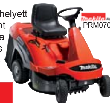
Makita Advance PRM0700

A PRM0700 azok számára megfelelő eszköz, akik a mechanikus váltó helyett inkább a hidrosztatikus váltást részesítik előnyben. További kényelmet jelent az elektromos önindító. A 12,5 LE-s motor, a 71 cm-es vágókéssel társítva hatékony és gyors munkavégzést biztosít 3.000 m 2 -es területig. A 170 literes fűgyűjtő kosár hatékonyabbá teszi a munkavégzést a ritkább ürítés következtében. Igény szerint mulcsozásra alkalmassá alakítható.