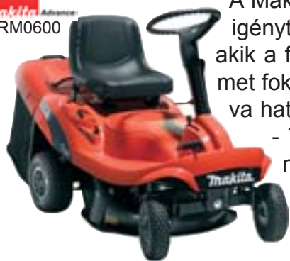
Makita Advance PRM0600

A Makita által forgalmazott fűnyíró traktorok a vevők által támasztott valamennyi igényt kielégítik. A PRM0600 ideális választás azon kiskerttulajdonosok számára, akik a fűnyírók tologatása helyett inkább a komfortot tartják szem előtt. A kényelmet fokozza az elektromos önindító. A 6,5 LE-s motor 62 cm-es vágókéssel társítva hatékony és gyors munkavégzést biztosít 2.500 m 2 -es területig. A fűnyírók 55 - 75 literes fűgyűjtőjével szemben a 140 literes kosár hatékonyabbá teszi a munkavégzést a ritkább ürítés következtében. A traktor igény szerint mulcsozásra alkalmassá tehető.