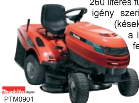
Makita Style PTM0901

A PTM0901 -es azok számára készült, akiknek a karbantartandó területe már lényegesen meghaladja egy fűnyíró kapacitását. A kulccsal indítható 13,5 LE-s motor, a két ellentétes irányba forgó, egyenként 46 cm-es vágókéssel társítva hatékony és gyors munkavégzést tesz lehetővé akár 4.000 m 2 -ig. A hidrosztatikus hajtás megkönnyíti a területen való haladást. Hétféle vágásmagasság állítható be 25 és 80 mm között. A 260 literes fűgyűjtő kosár állapotáról a telítettséjelző ad információt. A fűnyírótraktor igény szerint mulcsozásra alkalmassá alakítható (kések + mulcsozóbetét). Ennek köszönhetően a levágott fű nem a kosárba kerül, hanem felaprítva a földre.